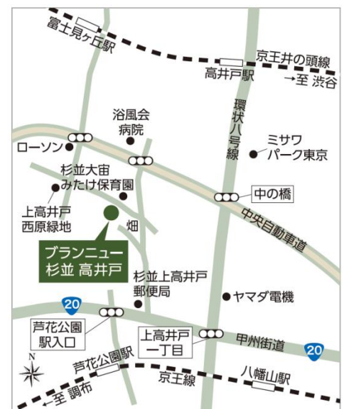
介護付き有料老人ホーム