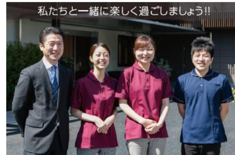
私たちと一緒に楽しく過ごしましょう!!

認知症や医療的ケアの必要な方にもご入居いただける体制を整えた有料老人ホームです。常に「その方らしさ」の追求を実践するために、スタッフは 基準の2倍となる人数 を配置します。